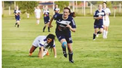
Här spelar Åbyggeby Fritidsklubbs damlag hemmamatch mot Hofors på Åbyggeby landsbygdscenter. Året är 2014.