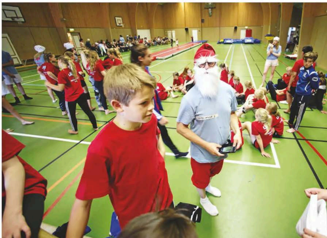
Här har Sandvikens Gymnastikavdelning, SGA, gymnastikläger på landsbygdscentret. Året är 2016.